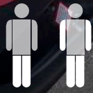
TABLA DE TRANSFERENCIA ELÉCTRICA